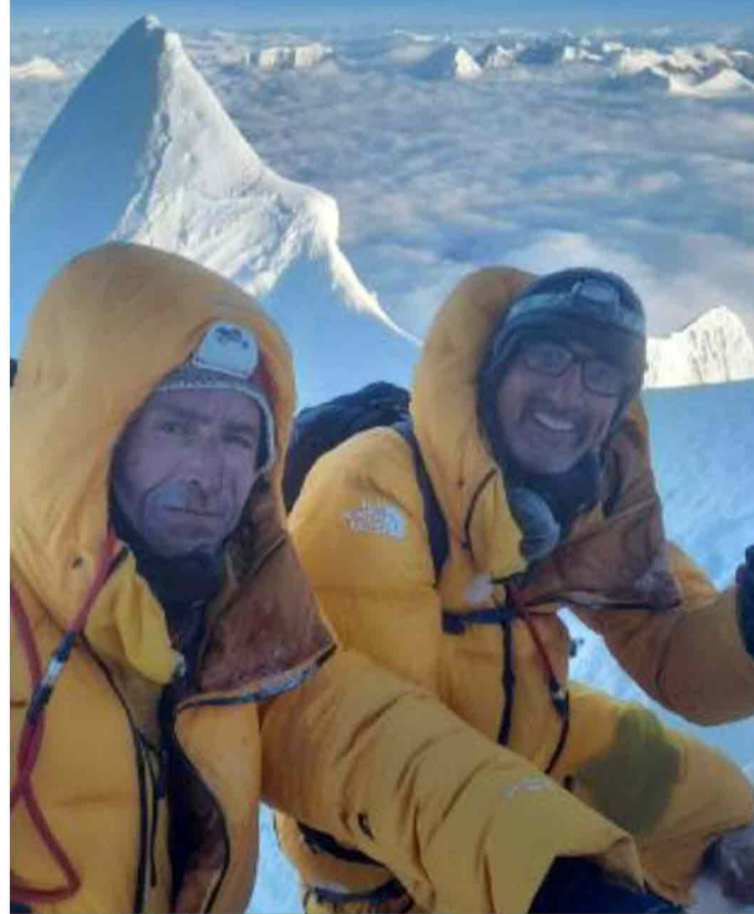
8 mila I due alpinisti del Cai Gardone Valtrompia in vetta