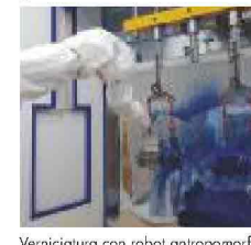
Verniciatura con robot antropomorfo

HUBO Automation S.r.l. CIVATE (LC) - Via Dell'Industria, 1 - Tel. 0341 550593 - info@hubo.it - www.hubo.it