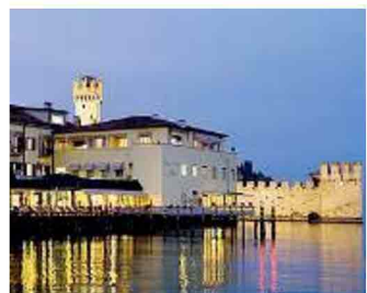
A Sirmione. Il Grand Hotel Terme

Il lungo racconto di più di un secolo di storia, idee, lavoro e investimenti