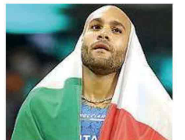
Lo sprinter. Marcell Jacobs